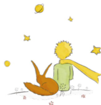
© Succession Antoine de Saint-Exupéry 2019