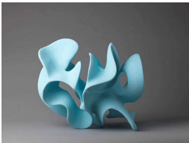
Algue Bleue, Grès Pigments, 50x40x35